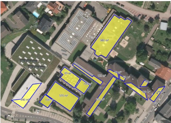
Potential für Photovoltaik auf dem Schulzentrum: 600.000 kWh pro Jahr!

Wir wollen eine lebenswerte Gesellschaft auf einem lebenswerten Planeten, für uns, unsere Kinder und Enkel und unsere belebte Mitwelt. Wir alle teilen eine Erde